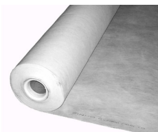
Floradrain® FD 40-E